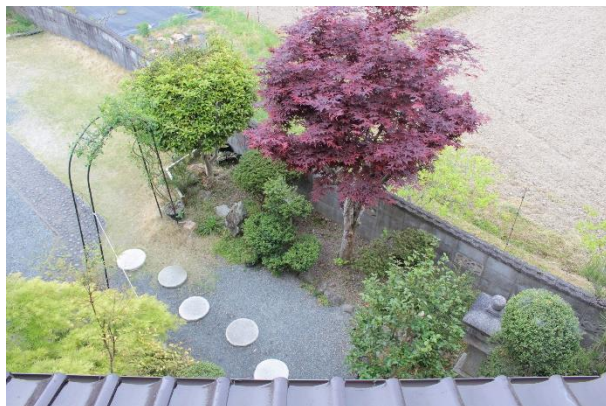
「 AM7 時の光 」