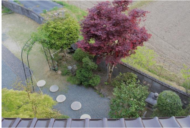
「 PM5 時の光 」